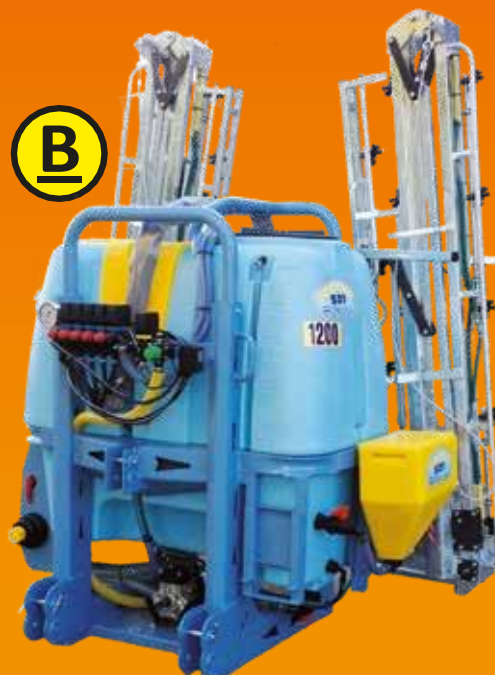
Tarif sur fiche technique n° 17

∞ Kit pour laver l'extérieur du pulvérisateur dans le champ