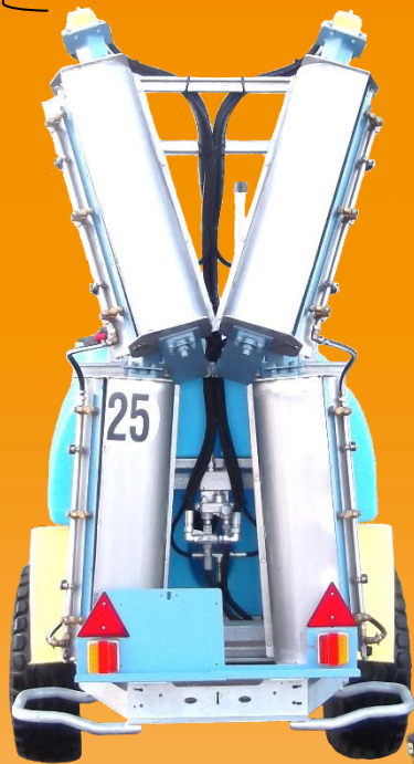
Module : turbines L880 X 4