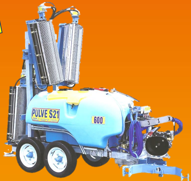
600L tracté type vignes étroites, largeur hors tout 1m05, 1m10

Ce matériel est agréé, par le ministère de l'agriculture, pour les limitations de dérive