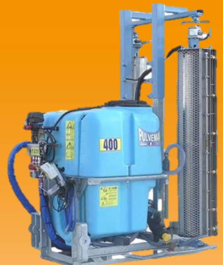
400L porté monoturbine H 1600