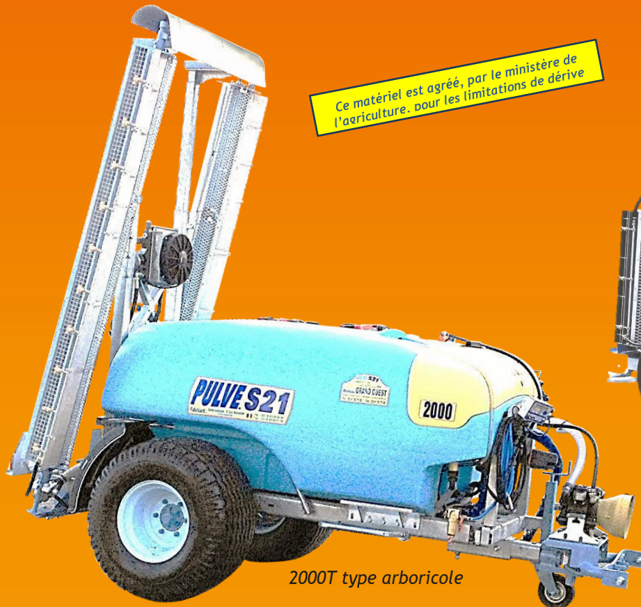
2000T type arboricole

COMPRIS : essieu frein hydraulique de série à partir du 2000L Réservoir cloisonné sur 5000L / Roues BP largeur 500 de série sur 5000L