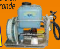
Soit en version turbine ronde

Ce matériel en jets portés est agréé par le ministère de l'agriculture, pour les limitations de dérive