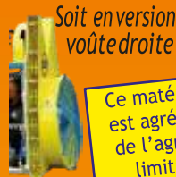
Soit en version voûte droite

Turbine 570mm Modèle basique 10 jets laiton obturables par rapport au modèle ci-dessus