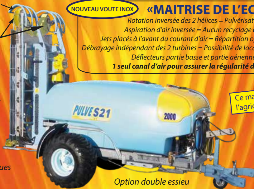
Option double essieu

Ce matériel est agréé, par le ministère de l'agriculture, pour les limitations de dérive