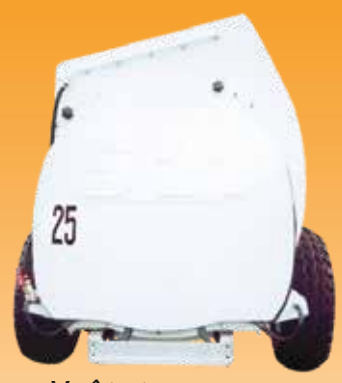
∞ Option : Voûte type noyers