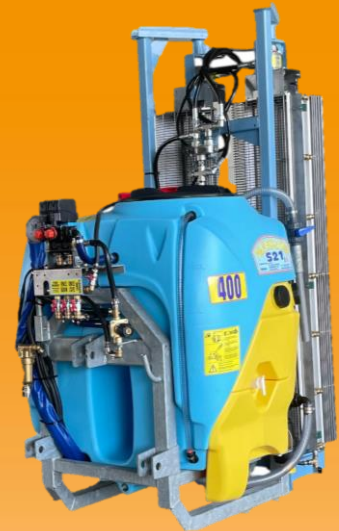
400L porté monoturbine H 1600