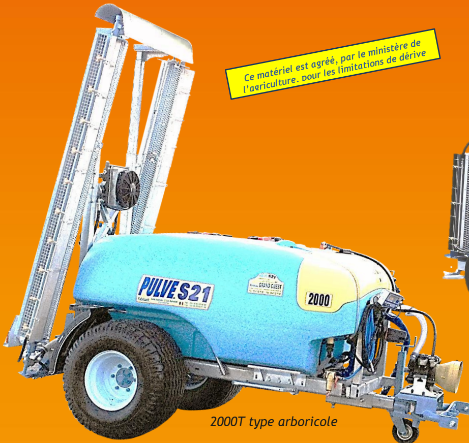
2000T type arboricole

Ce matériel est agréé, par le ministère de l'agriculture, pour les limitations de dérive